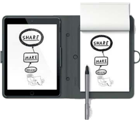
Spark snap-fit iPad