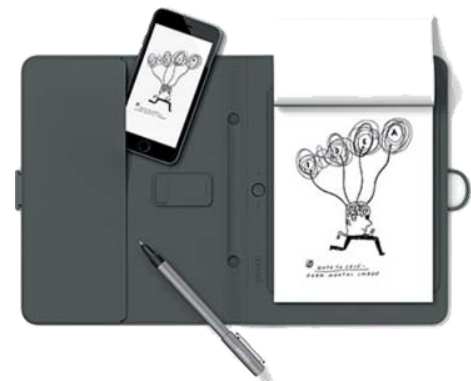
Spark, gadget pocket

אוגדן חכם, עם מעטפת חכמה להחזקת טבלט עד גודל של 9.7 אינץ'